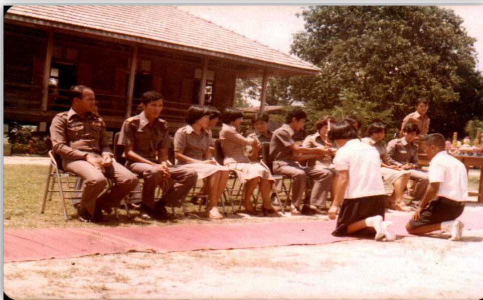
การเรียนการสอน (วันไหว้ครู) ปีพ.ศ. 2520

ต่อมาเมื่อโรงเรียนบ้านมะขามฯ ได้โอนไปสังกัดองค์การบริหารการศึกษาส่วนจังหวัด เมื่อปี พ.ศ. 2509 ที่ดินและอาคารเรียนแห่งนี้จึงทิ้งร้างตลอดมา จนเมื่อมีการเสนอขอจัดตั้งโรงเรียนดังกล่าวข้างต้น กระทรวงศึกษาธิการ จึงประกาศจัดตั้งโรงเรียนมัธยมศึกษาประจำอำเภอมะขามขึ้น เมื่อวันที่ 22 มกราคม พ.ศ.