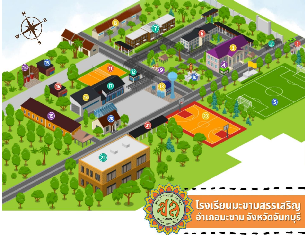
โรงเรียนมะขามสรรเสริญ อำเภอมะขาม จังหวัดจันทบุรี

โรงเรียนมะขามสรรเสริญ ตั้งอยู่ เลขที่ 192/3 หมู่ 1 ต.มะขาม อ.มะขาม จ.จันทบุรี มีพื้นที่ทั้งหมด 84 ไร่ สภาพพื้นที่ที่เป็นที่ราบลูกฟูก สลับที่ราบต่ำ สภาพโดยทั่วไปเป็นดินดอน ทางด้านทิศใต้ติดหนองน้ำสาธารณะหนองตาพอง พื้นที่รอบโรงเรียนโดยเฉพาะทางด้านทิศตะวันออกและทิศตะวันตก สภาพภูมิศาสตร์เป็นที่ราบต่ำ มีลักษณะเป็นทุ่งรับน้ำ โรงเรียนได้จัดแบ่งพื้นที่ตามแผนผังดังนี้