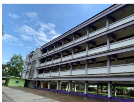
อาคาร 318 ล/38 พิเศษ สร้างปี พ.ศ.2556

ปีงบประมาณ 2556 โรงเรียนได้งบประมาณก่อสร้างอาคารเรียน แบบ 318 ล/55 ซึ่งเป็นอาคารเรียนแบบใหม่ เป็นเงินจำนวน 17,700,000.- บาทแต่มีปัญหาเหมือนกันทุกโรงเรียนทั่วประเทศคือไม่สามารถก่อสร้างได้ เนื่องจากค่าก่อสร้างจริงสูงกว่ามาก สำนักงานคณะกรรมการการศึกษาขั้นพื้นฐานได้มีหนังสือที่ ศธ 04229/171 ลงวันที่ 3 มิ.ย. 2556 อนุมัติเปลี่ยนแปลงอาคารเรียนเป็น อาคารเรียนแบบ 318 ล/38 พิเศษ โดยงบประมาณ 17,700,000 บาท เท่าเดิม ลักษณะของอาคารเรียนแบบ318 ล/38 พิเศษ เป็นอาคาร 4 ชั้นใต้ถุนโล่ง จำนวน 18 ห้องเรียน แต่เนื่องจากราคาก่อสร้างอาคารเรียนสูงเกินกว่างบประมาณที่ได้รับ ในการประกวดราคาได้ผู้รับจ้าง หลังต่อรองราคา สรุปค่าก่อสร้างที่ 18,000,000 บาท ทำให้โรงเรียนต้องขอความอนุเคราะห์จากผู้มีจิตศรัทธา ต่าง ๆ เพื่อหาเงินมาสมทบในการก่อสร้างต่อไป