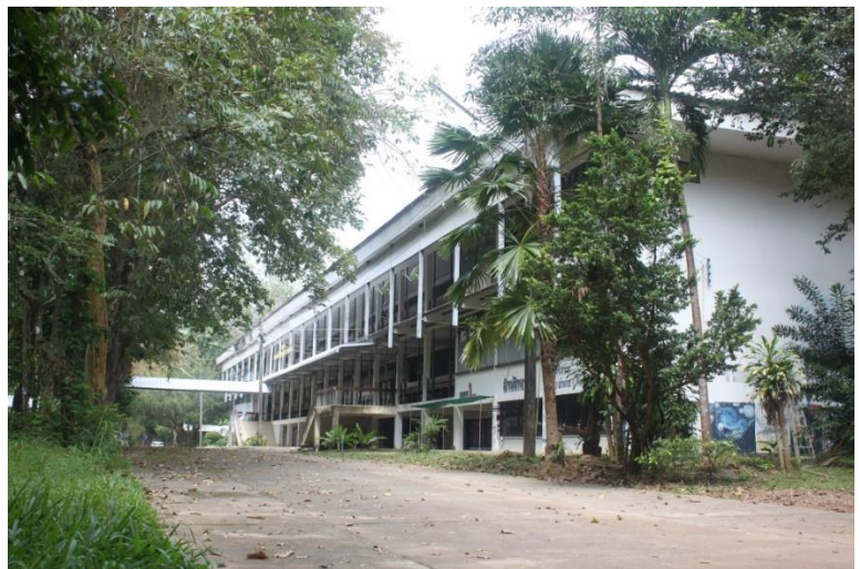
อาคาร 216 ก สร้างปี พ.ศ. 2520

ระหว่างปีงบประมาณ 2526–2530 โรงเรียนเข้าโครงการโรงเรียนมัธยมศึกษาเพื่อพัฒนาชนบท (มพช.2 รุ่น 2) ในการนี้โรงเรียนได้รับงบประมาณก่อสร้างอาคาร CS 213 B โรงฝึกงาน และอุปกรณ์ทางการศึกษาต่างๆ เป็นเงินไม่น้อยกว่า 7 ล้านบาท